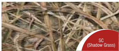
SC (Shadow Grass)